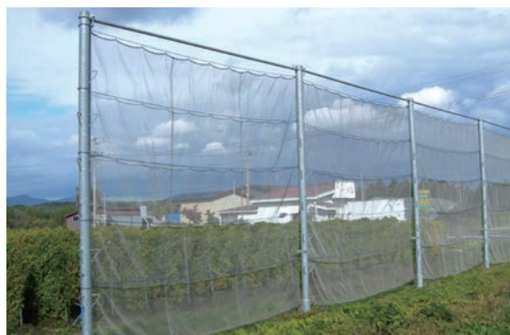
農園防風ネット リヒレンEV