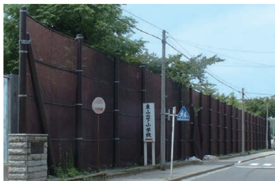
学校グラウンド防砂ネット リヒレンV